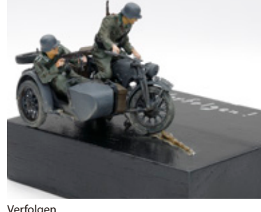
Verfolgen 久保 信也 東京