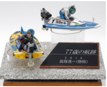
77歳の航跡 2014 高塚清一 (静岡) 井手 隆史 長崎