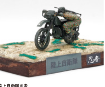
陸上自衛隊忍者 榎屋 旭 大阪