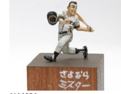
さよならミスター 井手 隆史 長崎