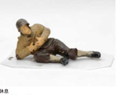
休息 殿見 卓郎 兵庫