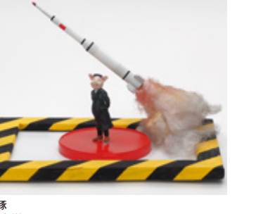
デブ熊 林 千海樹 山口