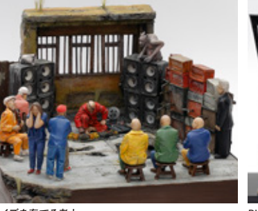
ノイズを奏でる老人 前澤 浩安 静岡