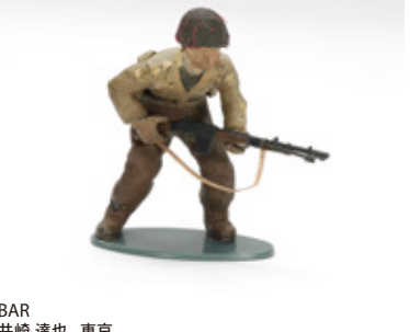
BAR 井崎 達也 東京