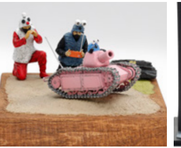
FUJWAI! ラジコン楽しい 秋山 巨匠 東京