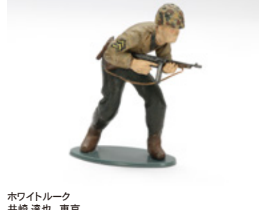
ホワイトルーク 井崎 達也 東京