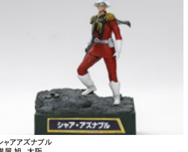
シャアアズナブル 榎屋 旭 大阪