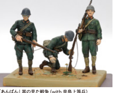
〔あんぱん〕嵐の見た戦争 (with 辛島上等兵) 増田 啓 京都