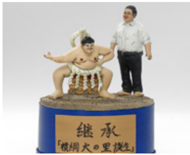
継承 [横綱大里 誕生] 木下 昌昭 青森