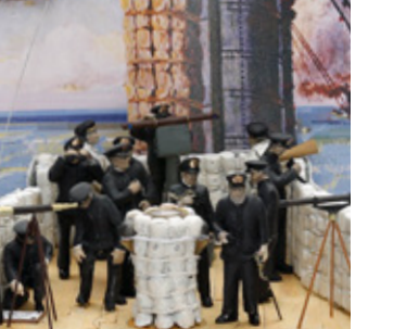
量産型兵在此一戦 田中 一成 東京