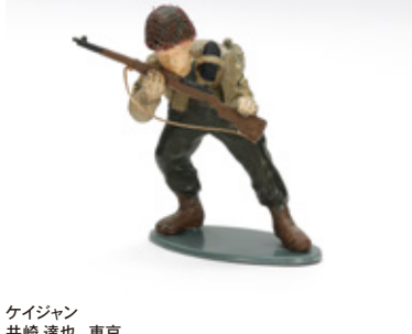
ケイジャン 井崎 達也 東京