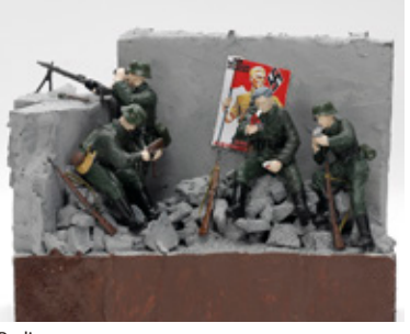
Berlin 為広 頼斗 広島