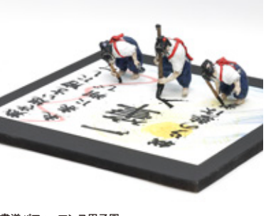
書道パフォーマンス甲子園 関口 光一 長野