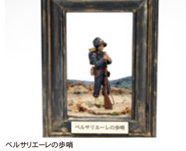
ベルサリーの歩哨 田宮 奈津子 茨城