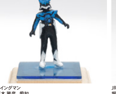
ウイングマン 栗木 雅彦 愛知