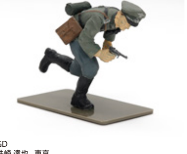
GD 井崎 達也 東京