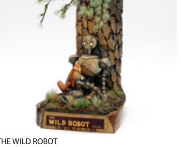
THE WILD ROBOT 小山 泰明 山梨