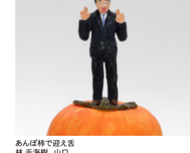
あんぱん棒で遊ぶ 林 千海樹 山口