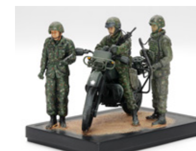
偵察報告 服島宏文 長野