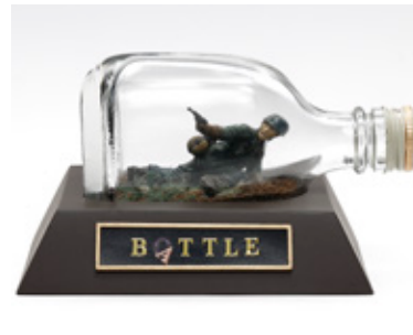
BO (A) TTLE 小松 健 東京