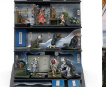
妖怪絵師の見た風景 八木 博顕 広島