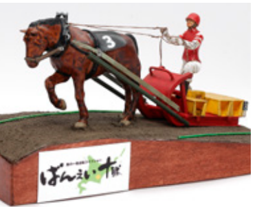
ばねいし驛馬 加納 芳之 北海道