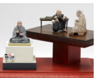
運慶、彫る 横井 雅彦 静岡