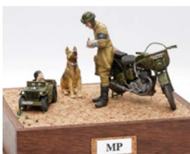
MP 丸野 吉明 宮崎