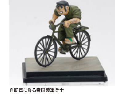
自転車に乗る帝國陸軍兵士 草香 和裕 広島