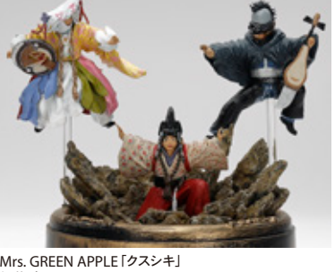
Mrs. GREEN APPLE「クスシキ」 伊藤 慶 山口