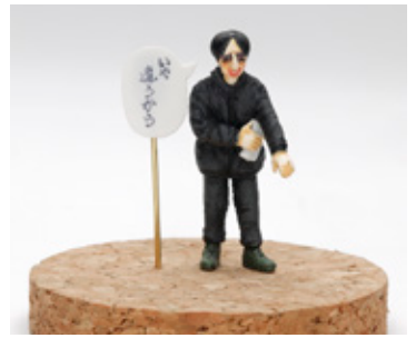
佐久間宣行 (キンタロー) 安俣 秀彰 埼玉