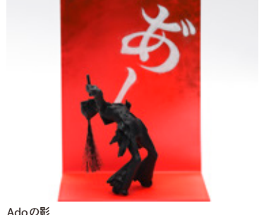
Adoの影 吉塚 政高 大阪