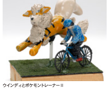
ウインディとポケモントレーナーII 佐々木 慎二 徳島