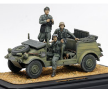
NORMANDY 1944 本村 浩幸 鹿児島