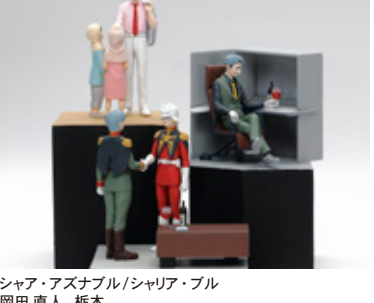
シャア・アズナブル/シャリア・ブル 岡田 直人 栃木