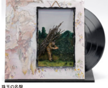
珠玉の名盤 ぼーじゆ中山 北海道