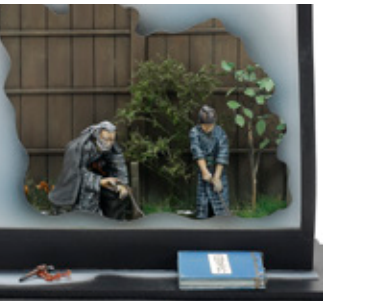
妖怪絵師の居る風景 八木 博顕 広島