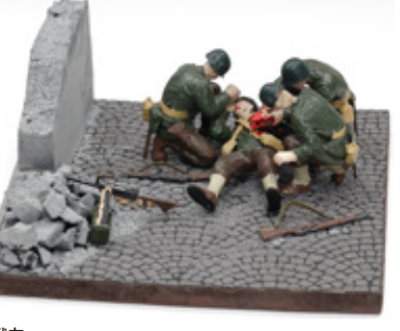
戦友 為広 頼斗 広島