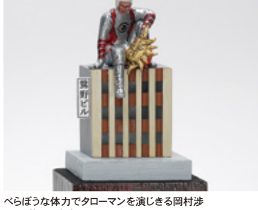
べらぼうな体力でタローマンを演じる岡村沙 山野 英樹 東京