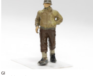
GI 殿見 卓郎 兵庫