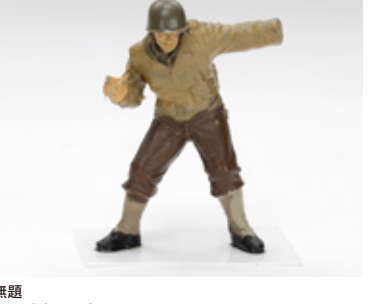
無題 殿見 卓郎 兵庫