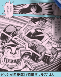
「ダッシュ! 四駆郎」(徳田ザウルス)より