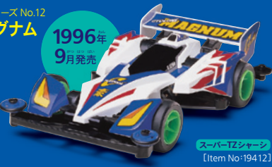
スーパーTZシャーシ [Item No:19412]

前後のカウルを小型化し、大型リヤウイングを装備。さらに電池の搭載位置を低くして低重心化も実現した3代目マグナム。