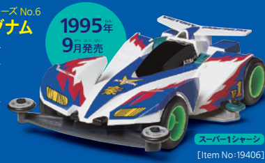
スーパー1シャーシ [Item No:19406]

マシン全体がシャープになった2代目マグナム。リヤウイングの小型化、フロントフェンダー後部の取り外しなど空力効果の高い11台だ。