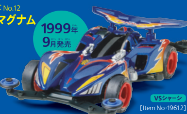
VSシャーシ [Item No:19612]

鋭いノーズや張り出したフェンダー、フラットな大型リヤウイングが迫力の5代目マシン。エアクラフトでモーター冷却効果も高い。