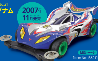
MSシャーシ [Item No:18621]

ミニ四駆25周年を記念して誕生。洗練されたブーメラン型のリヤウイング、曲面構成のボディに3分割のMSシャーシをセット。