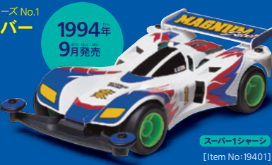
スーパー1シャーシ [Item No:19401]

前後のタイヤをカバーするフルカウルミニ四駆の記念すべき第1弾マシン。小径スリックタイヤに蛍光グリーンのホイールが特ちょうだ。