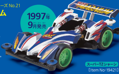
スーパーTZシャーシ [Item No:19421]

コクピットサイドのコイルスプリングとダンパーやフラップ付きの大型リヤウイングが特ちょう的。最高速重視の大径タイヤを採用。