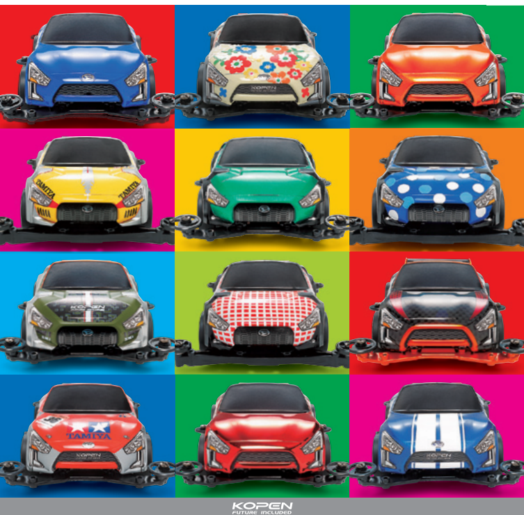
KOPEN future included