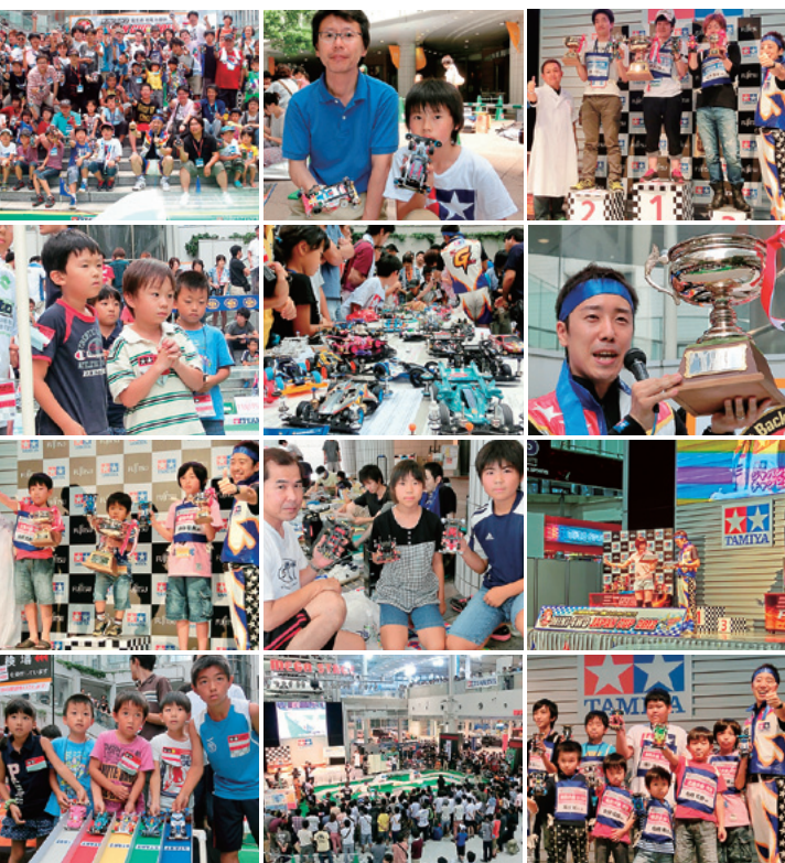
▲ミニ四駆ジャパンカップ2013の様子