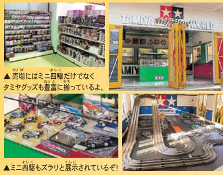
▲ミニ四駆もスリと展示されているぞ!

おもちゃがたくさん体験できるテーマパーク“おもちゃ王国”の中にあるのが“タミヤワールド”。ミニ四駆や模型、RCカーなどのタミヤ製品が一堂に展示されているのに加え、アップダウンの激しい巨大な3レーンコースが室内に常設されているぞ! ぜい、キミのマシンでチャレンジしてみてほしい。