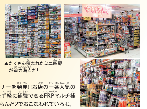
▲たくさん積まれたミニ四駆が迫力満点!

おもちゃがぎっしり陳列された店内の一角に、充実した品揃えのミニ四駆コーナーを発見!!お店の一番人気のキットはフルカウルミニ四駆シリーズ、そして一番人気のパーツは様々な部分を手軽に補強できるFRPマルチ補強プレート (ITEM 15193) とのことだ。月曜日に開催される定期レースは、ゆめらんど2でおこなわれているよ。