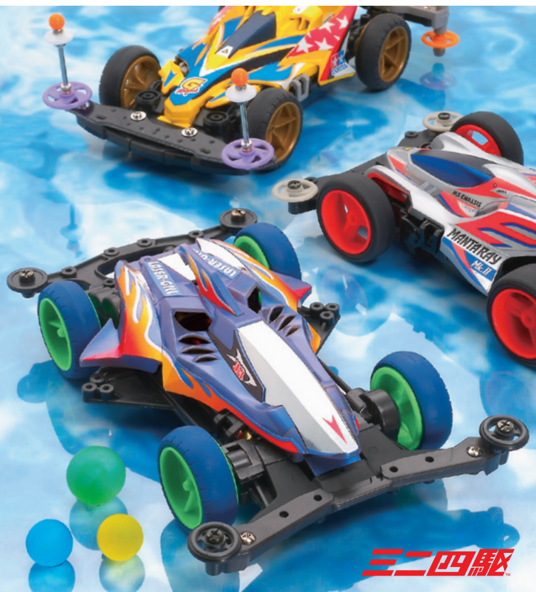
ダブルエックス レイザーギル スーパーXXスペシャル