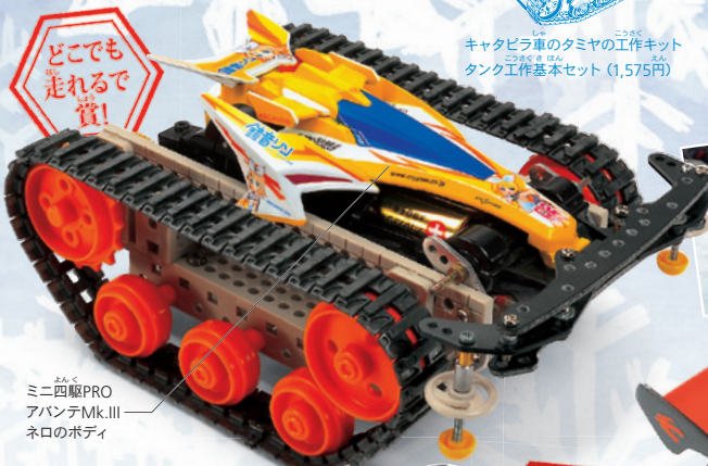
ミニ四駆PRO アバンテMk.III ネロのボディ