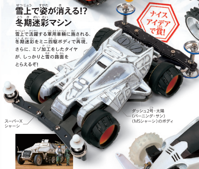
スーパーX シャーシ

雪上で活躍する軍用車輛に施される、冬期迷彩をミニ四駆ボディで再現。さらに、ミゾ加工をしたタイヤが、しっかりと雪の路面をとらえるぞ!