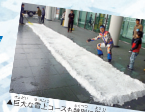
▲巨大な雪上コースも特別に用意されたのだ!