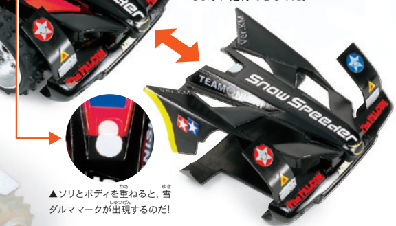
▲ソリとボディを重ねると、雪ダルマークが出現するのだ!

ミニ四駆PRO・ネオファルコンのボディと車のスケールモデルのパーツを使って、フロント周りをカバーするソリユニットを作成。これにより、雪上を滑るように走行できるのだ。