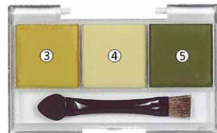
ウェザリングマスターAセット(サンド・ライトサンド・マッド) 600円(税込630円)