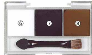
ウェザリングマスターBセット(スノー・スササビ) 600円(税込630円)