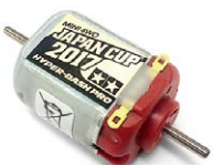
ハイバードッシュモーターPRO J-CUP 2017 6月発売 420円(税別)

ジャパンカップ開催を記念したスペシャルアイテム「トライゲイル ジャパンカップ 2017」がリリース決定! さらにモーターやHGカーボンステアに加え、ミニ四駆35周年を記念したメッキホイールやフェスタジョーヌ・クリヤーボディ、そして謎の新シャーシも発表された!! これは見逃せないぞ!