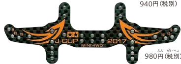
HGカーボンマルチワイドドライバステア(1.5mm) J-CUP2017 980円(税別)