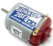
ハイバードッシュ3モーター J-CUP 2017 6月発売 400円(税別)