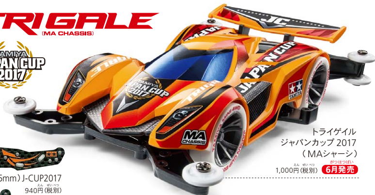
トライゲイル ジャパンカップ 2017 (MAシャーシ) 1,000円(税別) 6月発売