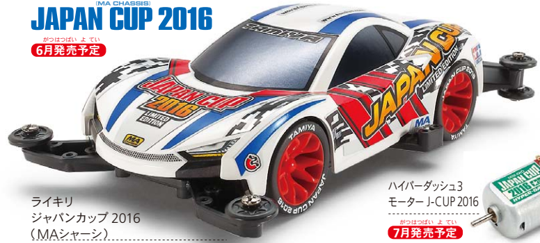
ライキリ ジャパンカップ 2016 (MAシャーシ)

ニュース 2 ミニ四駆をさらに楽しむ公式スマホアプリ イベント検索&応募がカンタン! タミヤパスポートがリリース