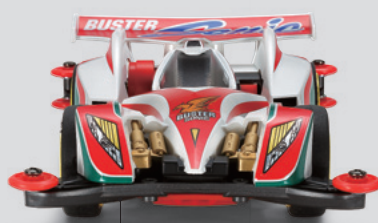
フロントバンパー