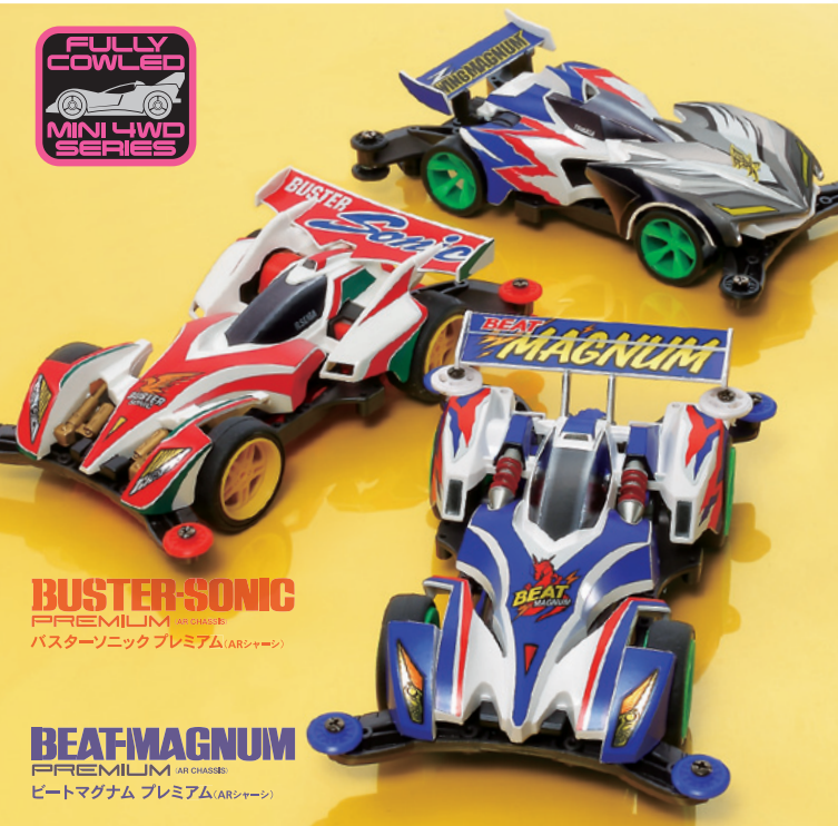
BUSTER-SONIC PREMIUM (AR CHASSIS) バスターソニックプレミアム(ARシャーシ)