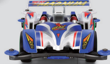
フロントバンパー

空力の追求はもちろん、整備性や剛性、拡張性などミニ四駆レースに必要な要素をかねそなえたメタリックグレイのARシャーシを採用。5本スポーク大径ホイールにはスリックタイヤを装着、マシンの最高速を伸ばすスピードマシンに仕上げられた。質感あふれるメタル調ステッカーもボディフォルムを引き締めているぞ。